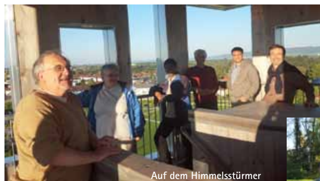
Auf dem Himmelsstürmer

gelaunt miteinander umzugehen und zu arbeiten.